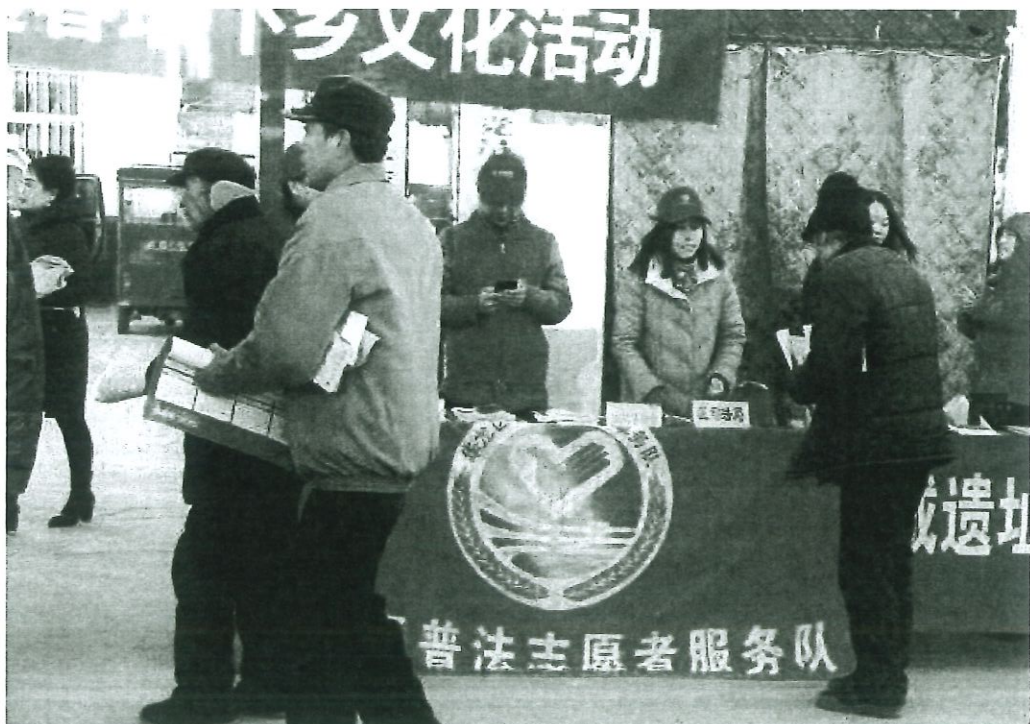
图为“12.4”普法志愿者向路人讲解普法知识